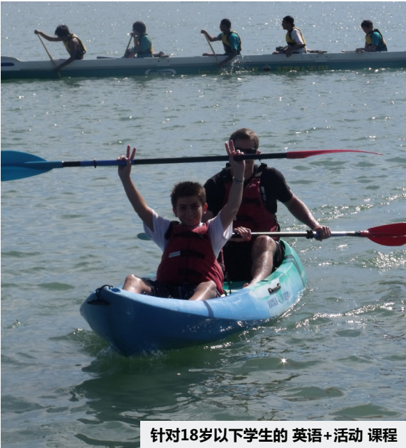
针对18岁以下学生的 英语+活动 课程