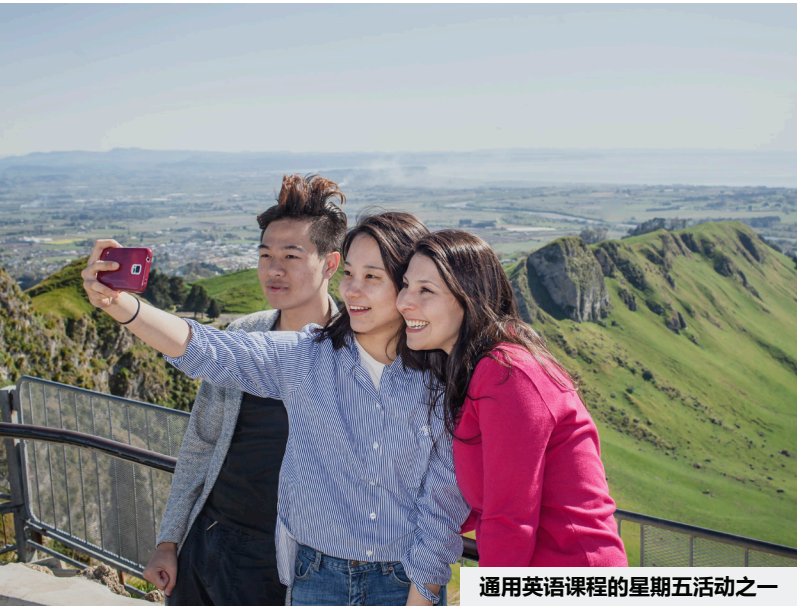
通用英语课程的星期五活动之一