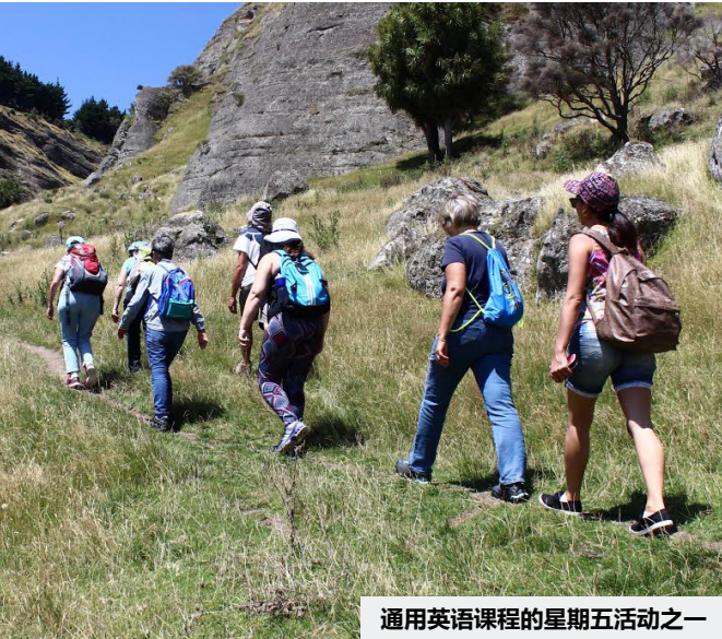
通用英语课程的星期五活动之一