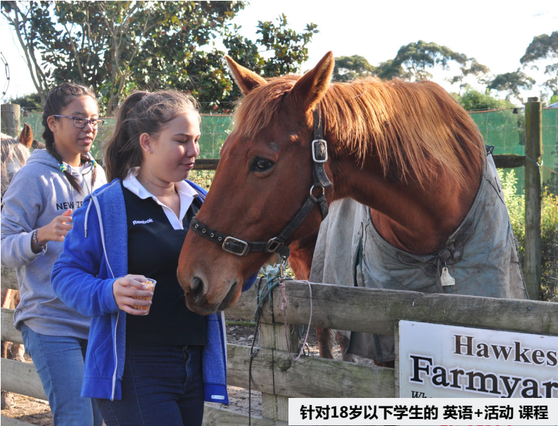
针对18岁以下学生的 英语+活动 课程