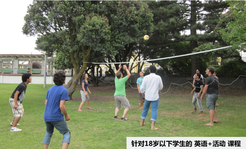
针对18岁以下学生的 英语+活动 课程